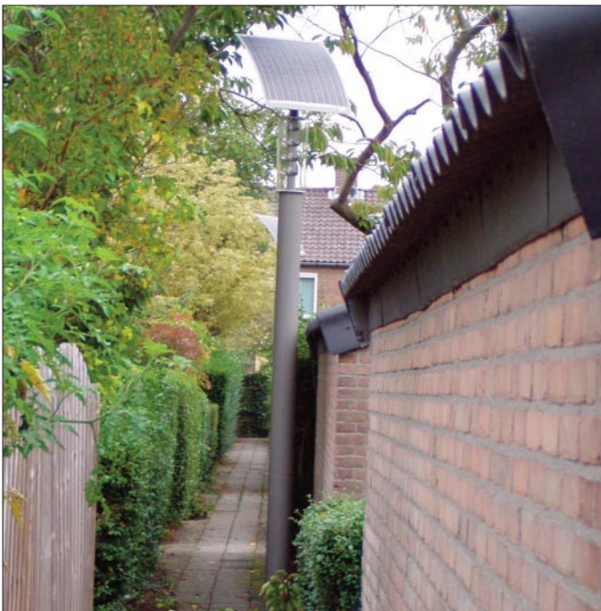
goede verlichting op een stille plek

Burgers hebben in toenemende mate last van verkeerslawaai. Het geluidsniveau van de A12 neemt toe door meer rijstroken, en ook de Randstadrail en de HSL leveren veel klachten op. Het is nodig dat er goed wordt nagedacht over geluidswerende middelen, en bestaande schermen moeten steekproefsgewijs worden getest of ze nog voldoen. Onderhoud en uitbreiding van fietsvoorzieningen zijn van levensbelang, net als duidelijke verkeerstekens en rood asfalt bij kruisingen met snelverkeer. Sociale fietsveiligheid moet worden