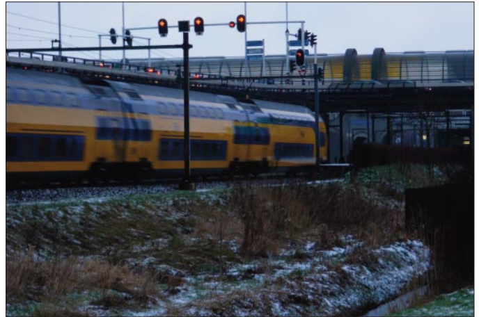
wat ons betreft stopt de intercity straks in Zoetermeer

bevorderd door stille plekken aan te pakken, door goede verlichting en door ruime zichtlijnen.