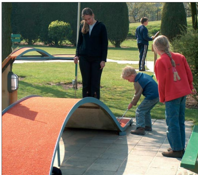
iedereen doet mee aan sport en bewegen

We willen projecten stimuleren die jongeren van de straat halen en naar sport en bewegen leiden. Dit kan toenadering geven tussen groepen die zich van elkaar afzonderen. Daarom moet er voldoende ruimte in de wijken zijn om bijvoorbeeld balspelen te doen. Sportverenigingen kampen in toenemende mate met een