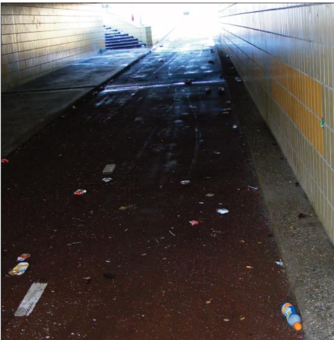
een donkere tunnel met zwerfafval geeft een onveilig gevoel

Wij willen in Zoetermeer streven naar 60% hergebruik van afval in 2015.