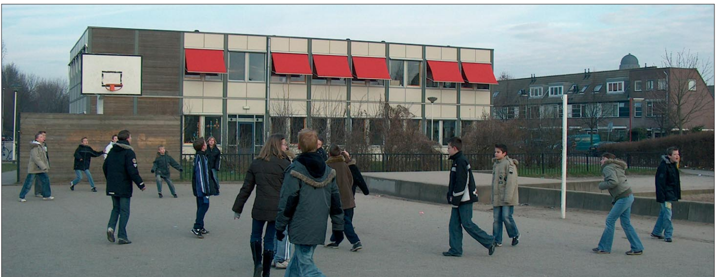
de brede school biedt kansen voor de ontwikkeling van mensen